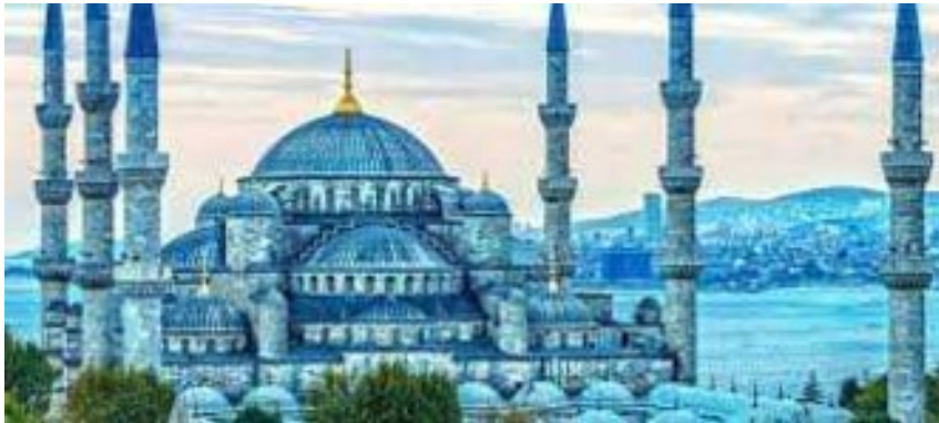
La mosquée bleue, à Istanbul

Il y a plusieurs lieux emblématiques, il y a surtout la Cappadoce et des mosquées, surtout à Istanbul, comme la mosquée Bleue ou Sainte-Sophie.