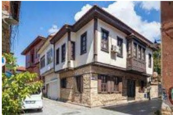
Maison traditionnelle, dans le centre ancien d'Antalya

L'architecture turque est très variée surtout à Istanbul car la ville est entre deux continents. Nous avons vu des maisons qui avaient des avancées en bois.