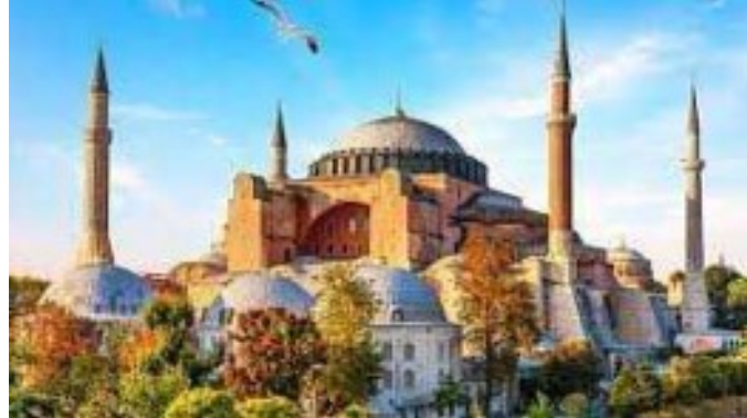
Sainte-Sophie à Istanbul ; ancienne église, devenue mosquée

Les Turcs sont majoritairement des musulmans (99,8%). On trouve quelques églises notamment en Cappadoce (creusées dans la roche) mais elles datent du Moyen-Âge mais elles ne sont plus utilisées.