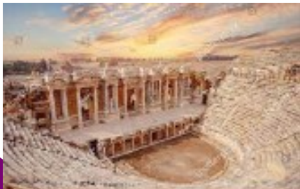
Le théâtre antique d'Hierapolis, pouvant accueillir 10 000 spectateurs !

Nous avons visité plusieurs sites archéologiques : des villes souterraines en Cappadoce, des Tombes lyciennes, des villes romaines très bien conservées comme Hierapolis ou Ephèse.