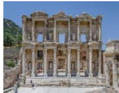
La bibliothèque de Celsus, sur le site d'Ephèse